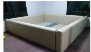
แบบสำเร็จรูปทำจากเบาะ

DDC กรมควบคุมโรค Department of Disease Control