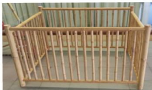
ทำจากไม้