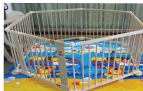
แบบสำเร็จทำจากไม้