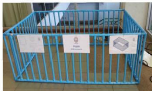
ทำจากท่อพีวีซี

ตัวอย่างพื้นที่เล่นที่ปลอดภัย คอกกั้นเด็ก (Playpen)